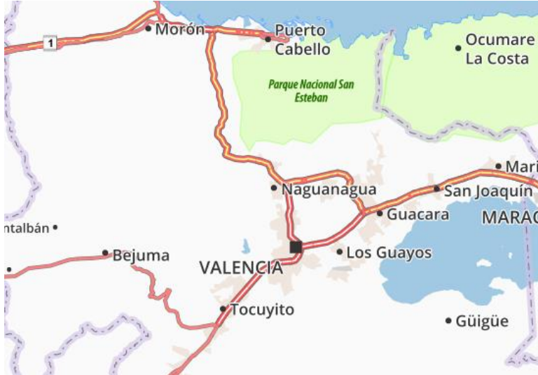
Posición geográfica del municipio Naguanagua