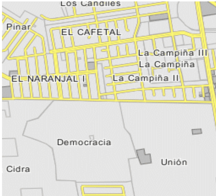
Ubicación geográfica sector La Cidra II